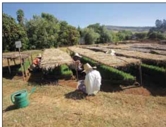
De små plantorna skyddas mot sol och regn av material som tillverkats av gräs och träslanor.

gerar, worka m.m. Det var intressant att se hur olika fort dessa plantor växte upp, beroende på hur mycket vatten deras rötter kom åt. Undervegetationen både buskar, gräs och blommor har ökat.