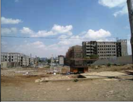
Stora hyreshuskomplex växer upp.