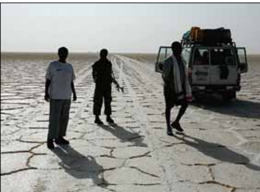
I det här landskapet är vägvisaren ett måste.

och packningen lastades på dromedarer. Därefter började den tre timmar långa vandringen genom ett mörkt lavalandskap. Runt vulkanen, som haft ett utbrott ganska nyligen, var marken het och man fick ta en omväg för att inte bränna skosulorna. Fast det var nog inte bara dom som hade kunnat komma till skada.