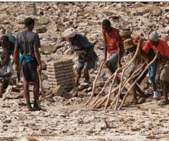
Vem som helst får spetta upp saltet, men yxan får bara användas av afarer.

av färg och som hela tiden förändras. Det puttrar och pyser, bubblar, småsprutar och rinner och vi som tittar på bilderna förundras över deras färger. Nyanser i blekaste gult till saffran, vitt till grått, lindblomsgrönt till ilsket ärtfärgat och så de orangea varmare tonerna som mörknar i brunt. Vilket eldorado för en fotograf.