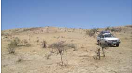
Region Afar - ett stundtals kargt landskap.

Jag ser mig omkring. Många av ”äldremännen”, som i själva verket är i min ålder