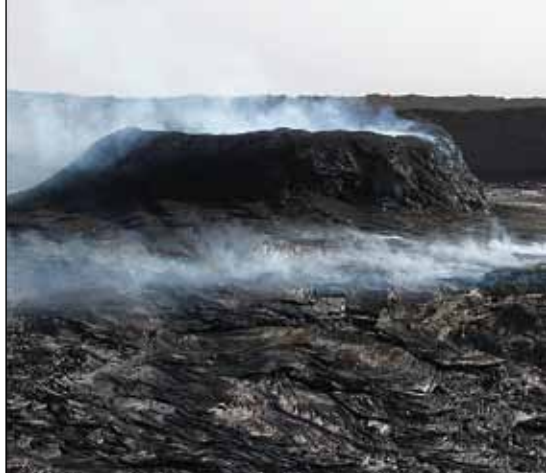
Efter senaste utbrottet såg Ertales mynning ut som en skorsten.

I samband med utbrottet hade vulkanens mynning förvandlats till en vid skorsten, varifrån det bolmade. Men det var först efter mörkrets inbrott och sedan man tagit sig upp på en näraliggande topp som man riktigt kunde njuta av det glödande skåde-spelet. Tre veckor senare hade "skorstenen"