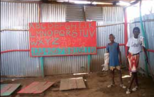
Stor skillnad är det på skoltillgången i de olika regionerna.

Fortfarande är andelen flickor som går i skolan något lägre. Sida samarbetar med UNICEF för att förbättra barns skolgång, speciellt då flickornas. Svenskt stöd ges också för att öka kvalitén på undervisningen.