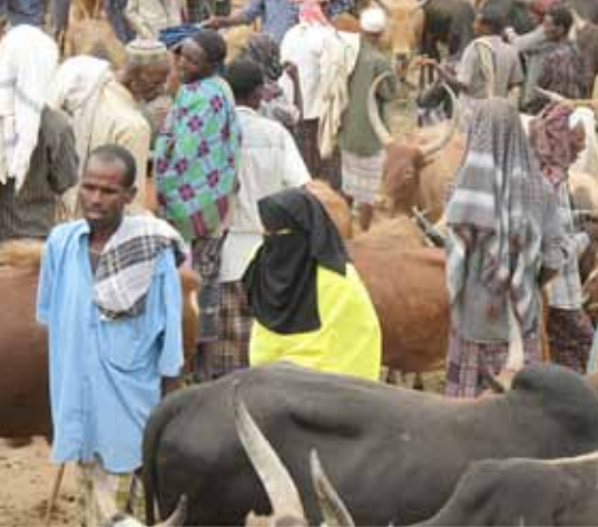
Boskapsmarknad i Senbete.