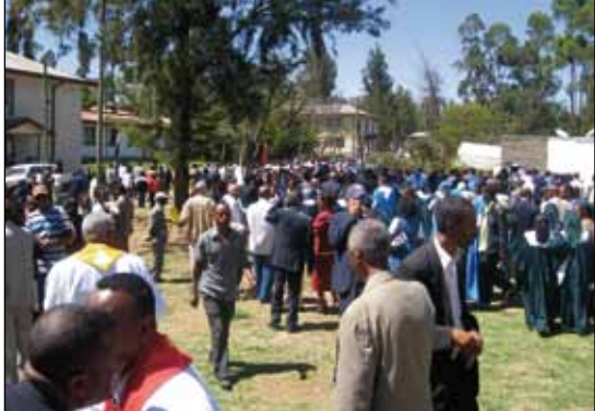
Välbesökt 50-årsfirande i Addis Abeba i början av februari.

I all den förändring och expansion som pågår i dagens Etiopien utmärks också kyrkorna av tillväxt och deltagande i samhällsutvecklingen. Det gäller inte minst Etiopiens Evangeliska Kyrka Mekane Yesus, EECMY, som konstituerades 1959 och som i dag har ett medlemsantal som överstiger fem miljoner.