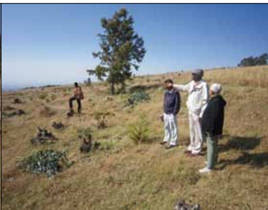
De nya plantorna planteras mellan stubbarna av eukalyptus .