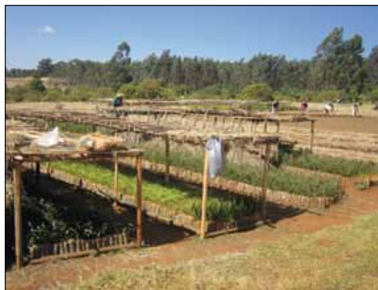
Projektet driver en egen plantskola.

Mellan dessa stubbar planteras de nya endemiska "inhemska" trädplantor som drivits upp på den egna plantskolan "plant nursery", t.ex birrbirra, teed, koso, weijra,