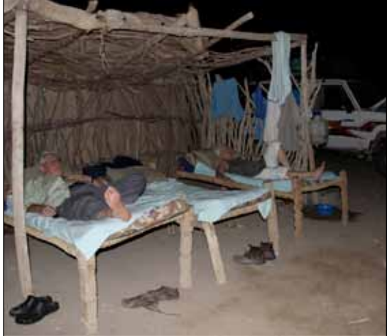
20 birr per natt kostar det att hyra sängen under stjärnhimlen.