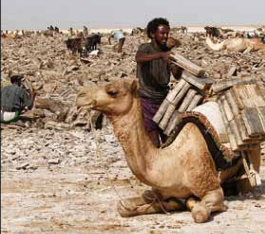
I högar travas saltplattorna på dromedarer, åsnor eller mulor.