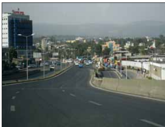
Överallt i Addis byggs nya vägar.

Även i Bishoftu byggs det. Jag fäste mig särskilt vid de gatstensbelagda vägarna mellan gabayan och "mässen". Vackert,