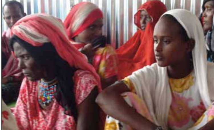
Kvinnorna talar förvånansvärt öppet om kvinnlig omskärelse.

År 1576 flyttade det västliga centret för islam sitt säte från Harar till Aussa, mitt