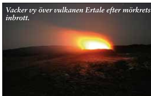
Vacker vy över vulkanen Ertale efter mörkrets inbrott.