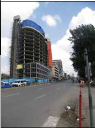
Nybyggnation i backen vid Churchill Road.

odlade rosor. Röda rosor som går på export. Precis som i Kenya, tänkte jag. Tillbaka i Stockholm såg jag, på SVT Play, programmet "Dokument utifrån: Land till salu" från den 4 februari, som handlar om Etiopien. I dokumentären kallas Etiopiens jordbruksland för GREEN