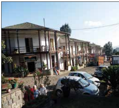
Det var i januari i år som Taitu Hotel drabbades av en häftig eldsvåda.

Taitu Hotel är ett praktexempel på etiopisk arkitektur när den var som bäst. Hotellet är byggt av "lera" och sten, eneträ och andra etiopiska träslag och har tak av korrugerad plåt. Receptionen och lobbyn