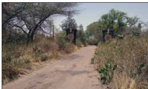
Gamla entrén till flygvapnet som inte längre används.

Vi togs emot av den ene officeren efter den andre, drack oändliga mängder kaffe och visades runt och filmade och fotograferade både gamla byggnader och den gamla porten. En av faktorerna som gjorde det möjligt att få tillstånd kan ha varit att de har ett museum som saknar en hel del information om tiden mellan 1945 och 1956 och att de hoppades höra vad jag kunde bidra med. Jag har lovat komma tillbaka och ha med det jag hittat om Air Force under åren 1945 – 1956.