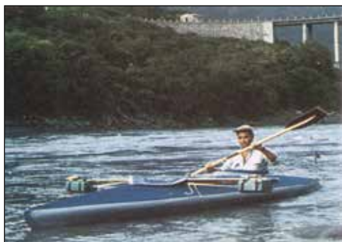
Bron i Shafarak i bakgrunden – det var här resan startade och på krokodilfronten är det ännu lugnt.