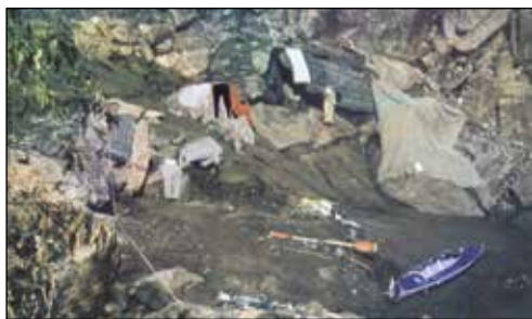
Ett nattligt oväder och det mesta är vått.

Den 9 november har de lämnat Massawa med båt för att ta sig till Suakim i Sudan. Därifrån har de under tolv dagar vaggat fram på kameler genom öknen för att komma till staden Berber vid Nilen. Efter en vecka på flodbåt på Nilen når de så Khartoum. Där provianterar de och seglar vidare uppför Blå Nilen i två veckor för att