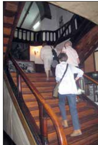
Ett ståndsmässigt ställe att äta och vila på - det var kejsarinnan Taitus idé med hotellet.