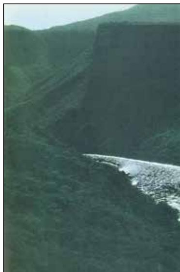
Blå Nilen – ett silverfärgat band inramat av skogsklädda sluttningar.

sedan, när de inte kan ta sig fram på floden länge, färdas på kamel till Famaka.