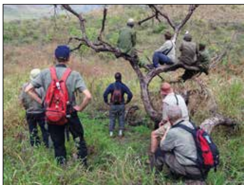
Elefantspaning i nationalparken Chebera Churchura.