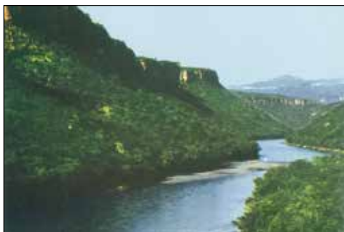
Blå Nilen och det gamla vadstället sedd från bron i Shafarak.