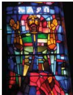
Konstnären bakom både mosaik- och glasmålningarna heter Endre Hevezi.

Hela kyrko- och klosterområdet vimlar av människor. Det är pilgrimer, handikappade och sjuka med hopp om att vattnet från grottan ska göra dem friska, liksom fattiga