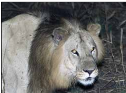
Vacker lejonhane i campens absoluta närhet.

fiskar. Rekordet blir en 118 cm lång fisk med lungor, en s.k. ”witt”. Vid torrperioden kan denna fisk gräva ner sig i leran och med hjälp av lungandning invänta nästa regn. En mycket nöjd fiskare bjuder på grillad fisk till kvällen. Delikat!