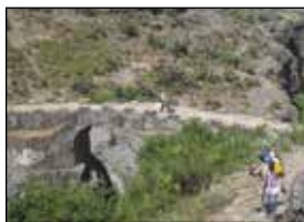
Den portugisiska bron en bit från kyrkan i Debre Libanos.

människor som hoppas på en allmosa. Fem religiösa skolor finns det inom området, som fortfarande spelar en viktig roll för den etiopiska ortodoxa kyrkan.