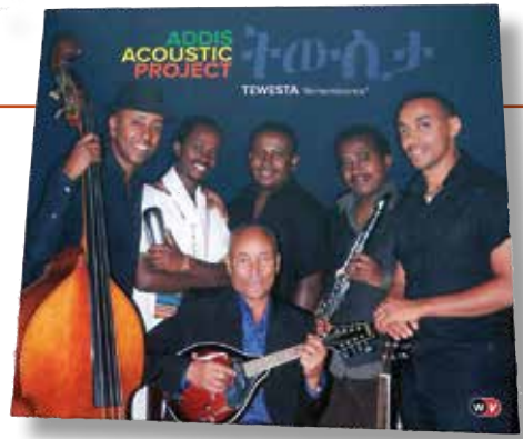
Addis Acoustic Project som spelade på baren JazzAmba på Taitu Hotel.