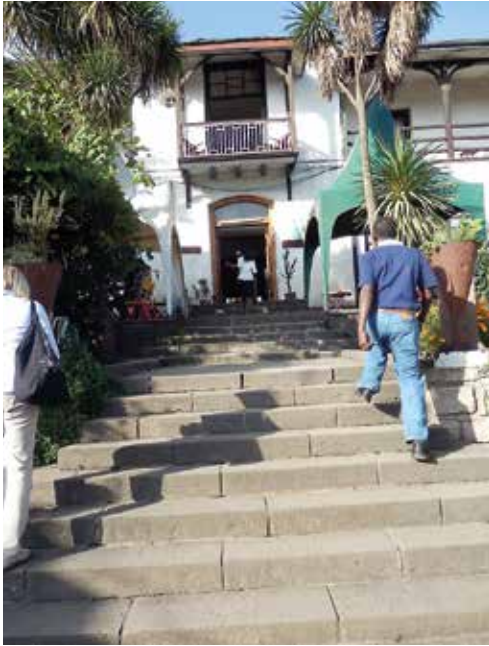
En lång trappa på hotellets baksida leder ner till trädgården och det övriga hotellkomplexet.

I mitten av mars fann jag på nätet en artikel med den trösterika rubriken ”Resurrecting History – Renovating Etege Taitu Hotel”. Det var en artikel publicerad den 11 mars 2015 av The Ethiopian Herald, som berättar att branden släcktes med hjälp av Addis brandkår, hotellpersonal, hotellgäster och andra frivilliga.