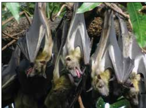
De fruktätande flygande hundarna.