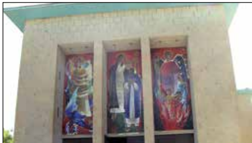
Entrésidans vackra mosaikbilder föreställande tre av ärkeänglarna.

Nästan omedelbart dyker prästen med den bruna huvudbonaden upp. Ett hundra bIRR per person – sen raskt in i museet. Inga