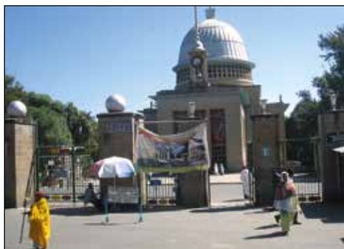
Kyrkan i Debre Libanos, byggd 1961, på uppdrag av Haile Selassie.

Stjärnhimlen över Sululta är betagande, kvällstemperaturen dock inte mycket att hurra för. Men vad gör det? Vi ska ju sova för att orka med nästa dags utflykt.