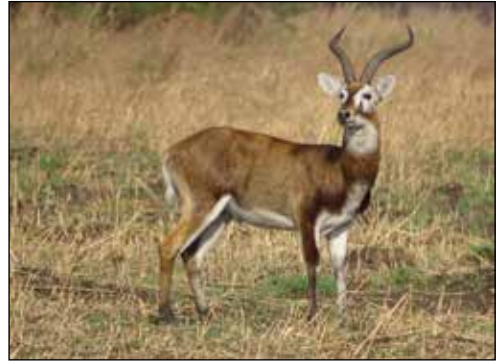
Ett tusental kobbantiloper såg gruppen ute på Gambelaslätten.

Hela tiden kollar babianerna in oss. Plötsligt ropar Brook, som går längst bak, att vi ska vända om. Snacka om överraskning, en halv meter från stigen ligger en pytonorm! Vi har alla passerat, men missat detta. Pulsen blir märkbar. Håkan och Staffan, som är de mest ormkunniga skattar att ormen mäter 3,5 meter. För att krama ihjäl en vuxen person krävs en längd på cirka 4 meter.