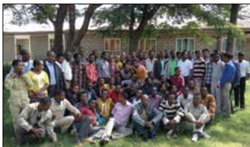
Ungdomsledare samlade i Hawassa för några dagars utbildning.

ute i församlingarna. Materialet kommer att finnas på amharinja, orominja och engelska.