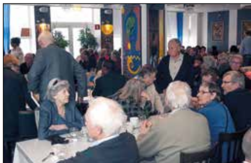
Som vanligt ett välbesökt årsmöte den 25 april på restaurang EthioStar i Stockholm.

Birgitta Karlström Dorph , Sveriges ambassadör i Etiopien 1988-1993, berättade om dramatiska dagar i Addis Abeba våren 1991 när Mengisturegimen störtades. Hon har skrivit om hur hon blev en aktiv del i dessa händelser i förra numret av Tenaestelin (nr 2, 2014). Nu berättade